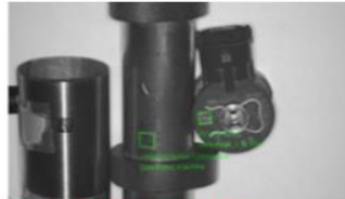
NEW 明るさのムラも問題なし！（CF37搭載HDR機能） 複数コードも読み取り可能！