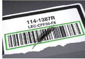
コードの汚れ・傷にも強い！