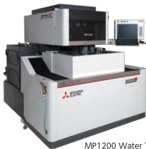
MP1200 Water Technology