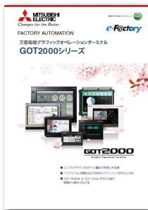
GOT2000シリーズカタログ (L(名)08268)

置き換えの詳細は以下のテクニカルニュース「GOT1000シリーズからGOT2000シリーズへの置き換えのご案内と注意事項」(GOT-D-0061)をご参照ください。