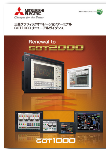
GOT1000リニューアルガイド (L(名)08306)