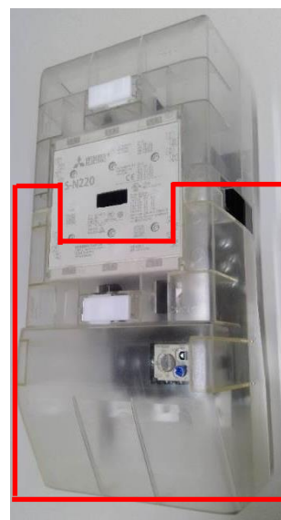
図 1. UN-CZ2201 (枠囲み部)

注 1. 適用形名には直流操作(SD、MSOD、DUD 等)及び機械ラッチ式(SL、SLD、MSOL、MSOLD 等)を含みます。