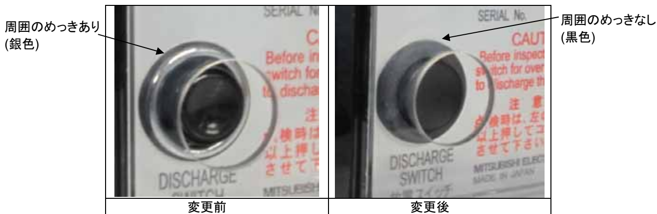
図 2 放電スイッチ拡大図