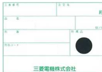
図2 梱包箱表面貼付けシール (黒丸印字)

2014年3月生産分より順次切替開始し、ネジが変更された製品につきましては 梱包箱表面に貼付けていますシールに黒丸を印字します (図2参照)。 尚、切替過渡期は変更前後の製品が混在することございますが、ご容赦お願い致します。 (黒丸印字期間 2014/3 ~ 2014/8)