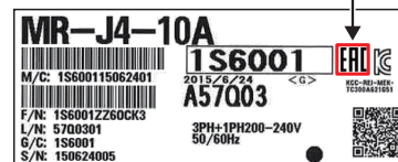
図2. 梱包ラベルへの印字例 (MR-J4-10A)