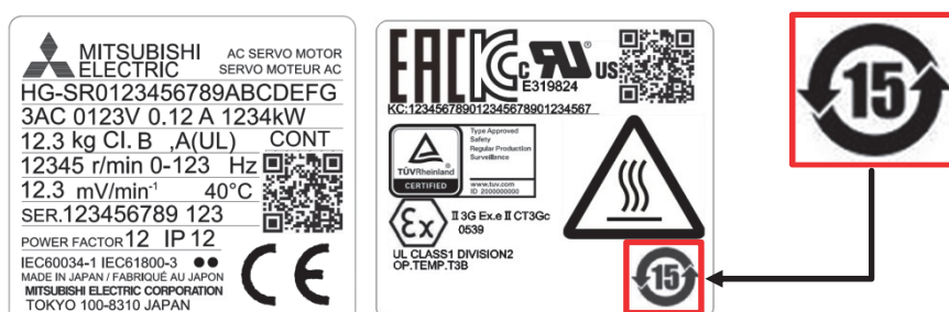
図1. サーボモータ本体ラベル 表示例

注. 図1に掲載するマーク表示位置及び記載内容は、一例であり、機種により異なります。