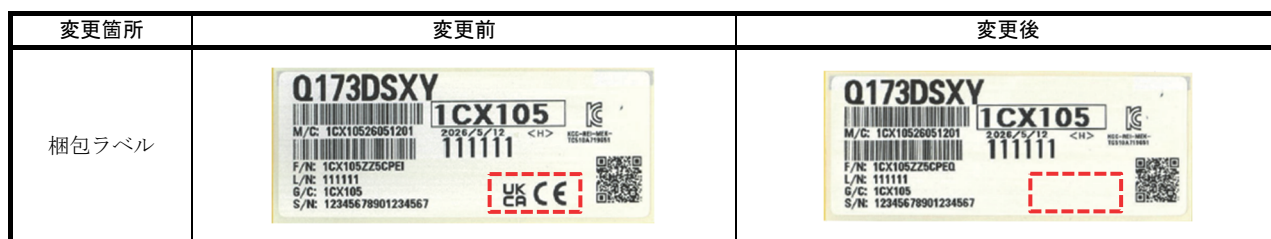
表2. 梱包ラベルの変更内容