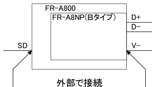
図3 V-端子とSD端子の接続

(*2) アースプレートを外したことで、交換後の動作に問題が生じる場合はアースプレートを戻すようにしてください。