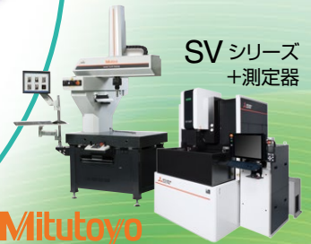
SV シリーズ +測定器