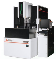
SV-P 半導体 パッケージ