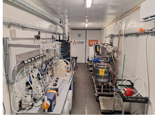
海水を介し大気中から CO 2 を回収する技術の実証機