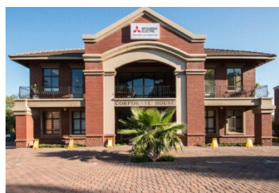
南アフリカ FA センターサテライトの アドロイト テクノロジー社が入居するビル