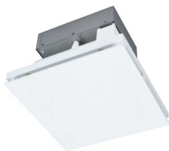
ヘルスエアー® 機能搭載 循環ファン「JC-10K シリーズ」