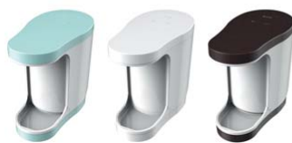
ハンドドライヤー「ジェットタオル プチ」