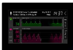
7.0 型 WXGA

三菱電機株式会社は、産業用カラーTFT 液晶モジュール「DIAFINE（ダイアファイン）」の新製品として、耐衝撃性や耐水滴性が求められる屋外用途向けに、厚さ 5mm の保護ガラス上から操作できる投影型静電容量方式のタッチパネルを搭載した 7.0 型 WXGA と 15.0 型 XGA のサンプル提供を 10 月 31 日から順次開始します。今回のラインアップ拡大により、計測器、建設・農業・工作機械、ガソリンスタンド向け POS 端末など幅広い産業機器に対応します。