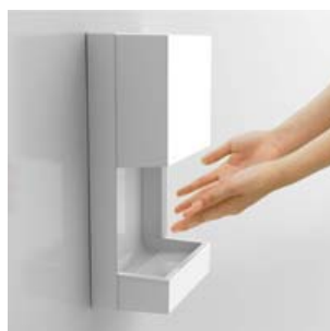
三菱ハンドドライヤー 「ジェットタオルミニ JT-MC105J」