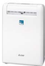
三菱衣類乾燥除湿機 「サラリ MJ-120MX」