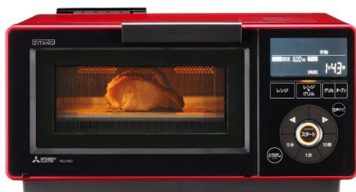
三菱レンジグリル 「ZITANG（ジタング）RG-HS1」