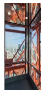
東京タワー トップデッキエレベーター