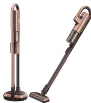
三菱コードレススティッククリーナー 「iNSTICK ZUBAQ」