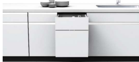
三菱ビルトイン食器洗い乾燥機「EW-45LD1MU」