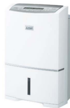
三菱衣類乾燥除湿機 大容量ハイパワータイプ 「MJ-PV240PX」