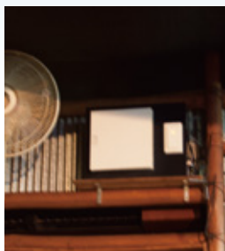
ワイルドな中に温もりを感じる内装に、シンプルな循環ファンが違和感なくとけこんでいる