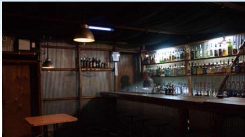
バックバーにはウイスキーが多い。ひと昔前は、地元岐阜県産として愛されて、惜しくも販売が終了した焼酎「バリハイ」も扱っていたという