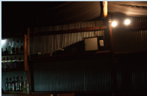
カウンター奥に1台を設置

「ヘルスエアー®機能」搭載 循環ファンを導入する前は、タバコの煙の排煙目的に換気扇を頻繁に運転しており、冬場は大型のファンヒーターが必要でした。二日に1回は灯油を補充するので一斗缶3缶を毎週購入していました。循環ファンの導入後は、タバコの煙も減らすことができ、換気扇の運転を減らすことができたので、今では中型のファンヒーターで暖房効果が十分に得られるようになりました。灯油の補充回数も三日に1回くらいになり、助かっています。また、夏場は常連客から「冷房の効きが悪くなるからあまり換気しないで」と言われていましたが、今ではそれほど頻繁に換気扇を運転せずに済んでいます。おそらく冷房用の電気代も減っているのではないのでしょうか。経営者としては、冷暖房のコストダウンというメリットはとても嬉しいですね。