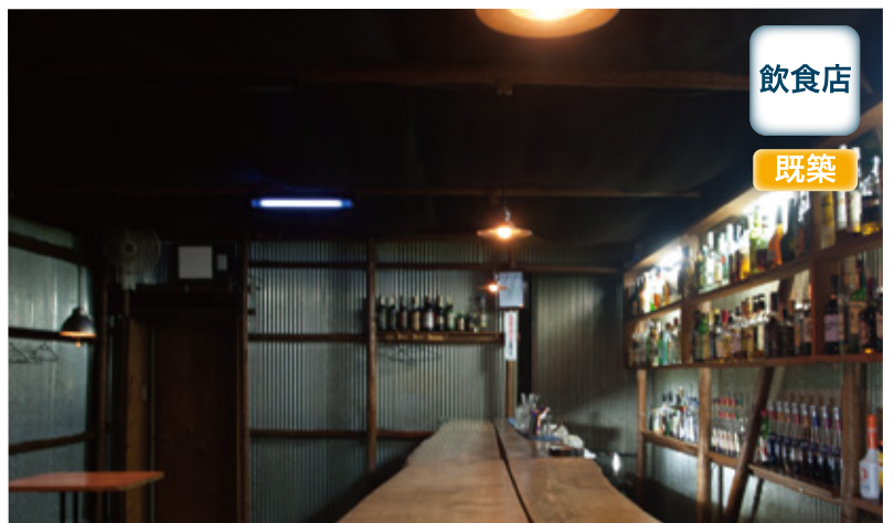
無垢の板材4枚で構成されたカウンターが印象的な店内。循環ファン2台のうち1台は店内奥の壁面に設置

設置当初は半信半疑だったというマスターですが、導入後しばらくしてタバコ臭の軽減をご自身で実感。喫煙しないお客様からも「以前とちがう」と驚かれるとか。さらに、タバコの煙の排煙目的として使っていた換気扇の稼働時間が減ったことで、冷暖房の省エネ・省コストにもつながったとのことでした。