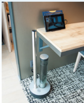
プレミアムフロアの床置型加湿器。 タブレットでは循環ファンの機能も紹介。