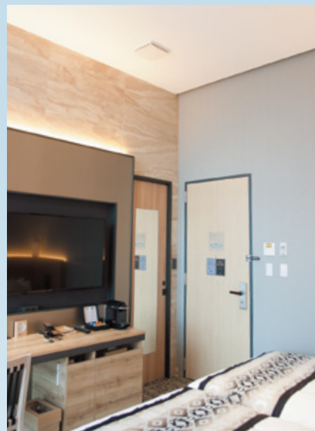
最上階プレミアムフロアの「ミュッセツイン」。 天井高約3.5m、窓はフルハイトで開放感がある。

検証した結果、集塵やニオイ対策に使えることがデータで裏付けられ、一番広いプレミアムフロアの客室（面積23.7㎡×高さ3.5m）でも有効とわかったので、導入を決めました。名鉄インさんが選んだ理由は①24時間稼働で空気清浄機能を期待できる ②客室を広く使える ③客室のデザインを確保できる、というもので、その通り実現できました。循環ファン自体もデザイン性を追求したホテルにふさわしいと思いますが、スイッチのデザインを選べるとより良いですね。ホテルの場合は機能説明も必要になります。良い製品を知ったので、デベロッパーとして今後は賃貸マンションなどにも導入を考えていきたいと思います。