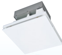
三菱「ヘルスエアー®機能」 搭載 循環ファン