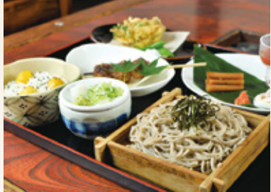
四季折々の旬の素材を活かした料理と二八の蕎麦を提供。

現在、循環ファンは、2階はお客様が入った時だけ、1階は24時間強運転で使っています。ニオイ対策で導入したわけではありませんが、ニオイがこれだけとれているならきっと他も…、と思っています。