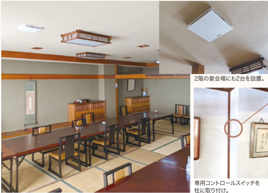
2階の宴会場にも2台を設置。