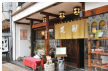
中津川の旬の味覚が味わえると、地元にもファンが多い。併営する「更科商店」の食材は大手百貨店での取扱も増えている。

お店は宴会などにも使われるため、パンデミックが起こった2020年、「窓がない」店内の空気環境を改善すべく、「地元産」(三菱電機中津川製作所が製造)の「ヘルスエアー®機能」搭載 循環ファンの導入を決定。市の補助金を利用して1階・2階に各2台ずつ設置し、お客様にはもとより、お店で働く方々にも喜ばれています。