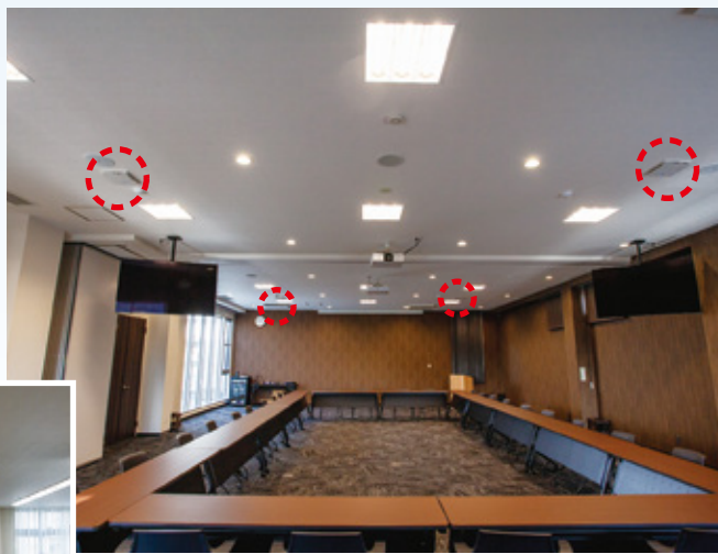
第1会議室には天井に4台設置。直径24cmのコンパクトデザインなので、照明やプロジェクターとの「取合い」も問題ない。