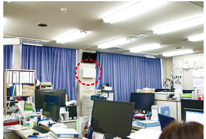
2号館の管理本部では壁掛けて設置。部屋の広さは約67㎡。

また、実際に使ってみると、まず朝出勤したときに部屋のニオイがなく、爽やかなことに驚きました。音も静かでまったく違和感がありません。花粉などのアレル物質も除去できると聞いていますので、今後は室内の環境測定を行い、数値的にいい結果が出れば、保健室・図書室・キャリア室などの他の部屋にも設置を検討したいと思っています。