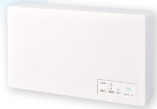
「ヘルスエアー®機能」搭載 循環ファン30畳用 JC-30KR(ワイヤレスリモコンタイプ)