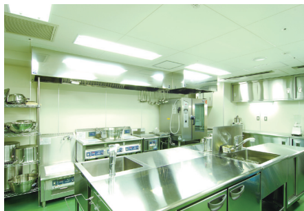
▲1日3食を全てこの厨房で調理