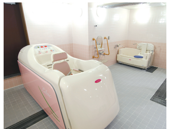
▲一階には機械浴を設置