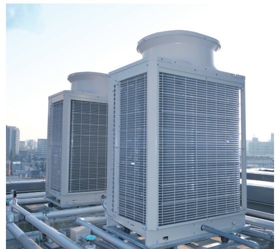
▲今回ご採用いただいた業務用エコキュート