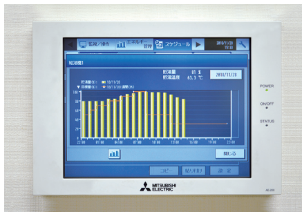
▲タンクの状態が一目でわかる 空調冷熱総合管理システムAE-200J