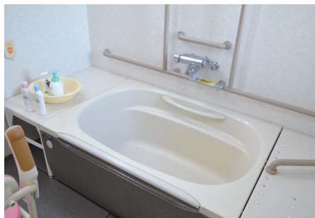
▲各フロアに設置された浴室