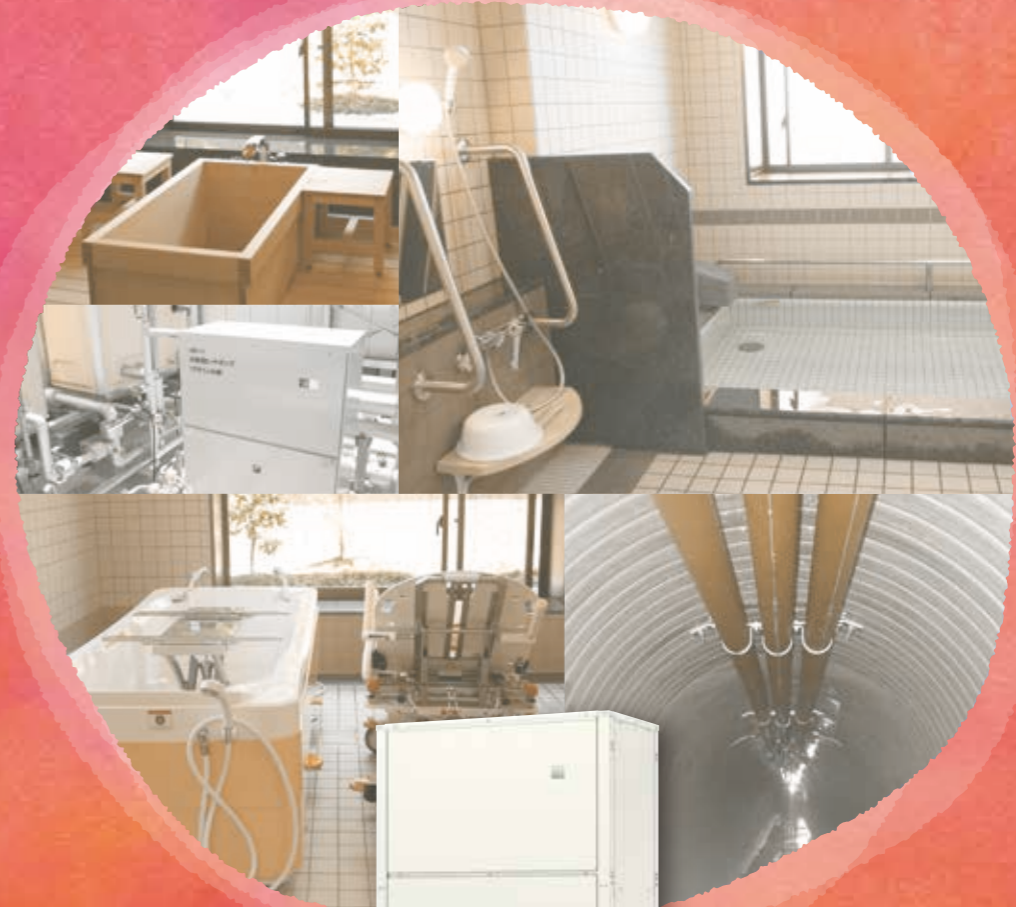
排熱回収型 水熱源ヒートポンプ 形名 CRHV-P650A, BCHV-P450A