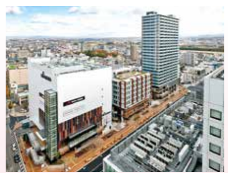
▲「豊田市駅前通り北地区第一種市街地再開発事業」で建設された新街区。施行区域面積は約1.6haで、中央が高齢者施設棟。それぞれの低層階には商業施設KITARAがある