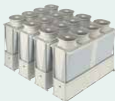
空冷ヒートポンプチャラー