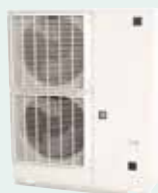
コンデンシングユニット