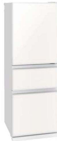
MR-CG33E-W ナチュラルホワイト