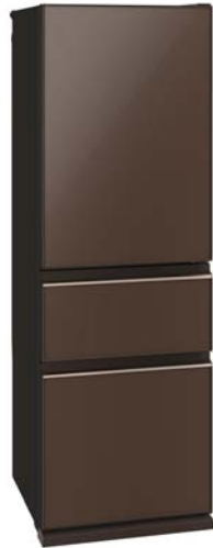
MR-CG37E-T ナチュラルブラウン

三菱電機株式会社は、幅 60cm スリムタイプの 3 ドア冷蔵庫の新シリーズとして、当社の 3 ドア冷蔵庫で初めてガラス面材を採用した上質なデザインで、調理時間の短縮をサポートする「氷点下ストッカー」を搭載した「CG シリーズ」2 機種を 4 月 19 日に発売します。