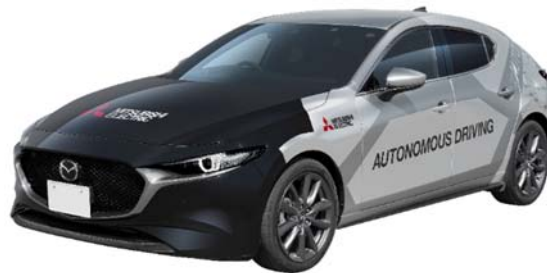
三菱電機 自動運転実証実験車「xAUTO」

三菱電機株式会社は、高精度な地図情報が整備されていない一般道での走行や屋内・屋外を問わない無人での自動駐車など、一般道のさまざまなシーンに適用できる新たな自動運転技術を開発し、自動運転実証実験車「xAUTO (エックスオート)」に搭載しました。当社は、本車両を「第46回東京モーターショー2019」(10月24日～11月4日、於:東京ビッグサイト)に出展します。