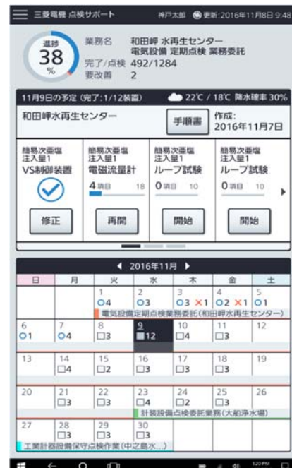
ダッシュボード画面