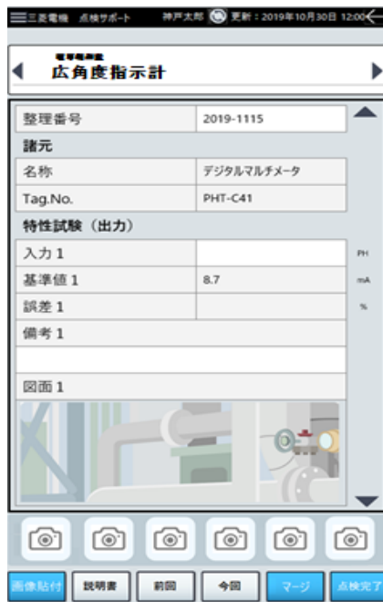
「InsBuddy®」専用アプリの入力画面例

現場で専用アプリに点検データを入力することで、点検事業者の事務所などでリアルタイムにデータを確認することができ、画面上で業務の進捗状況などを共有できます。