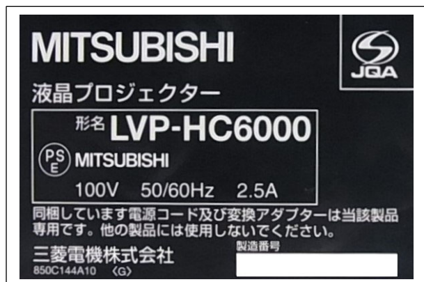
図2. 定格銘板例 (LVP-HC6000)

上記の方法でもわからない場合は、 こちらのページに記載された方法 でお問い合わせください。