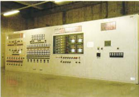
▼ オゾン監視操作盤