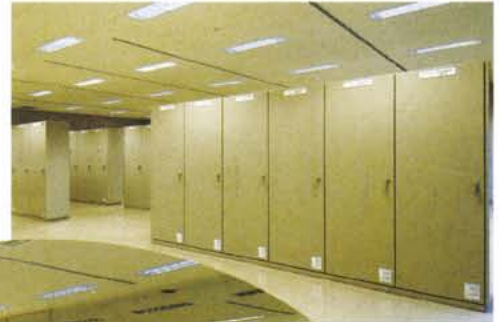
▼ 中央監視操作装置