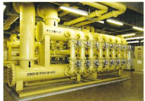
▲ オゾン分配ヘッダ