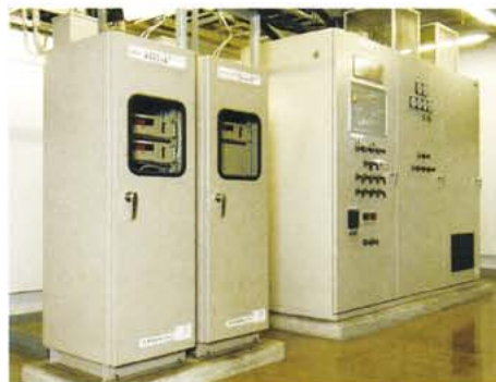
▲ オゾン濃度測定装置