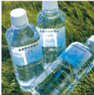
▲ オゾン+粒状活性炭高度処理水