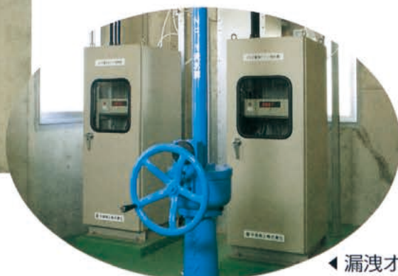
◀ 漏洩オゾン検知器