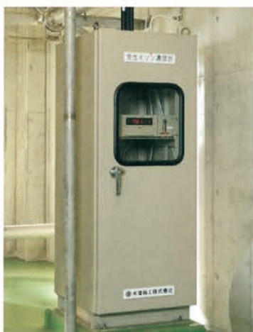
▲ 発生オゾン濃度計