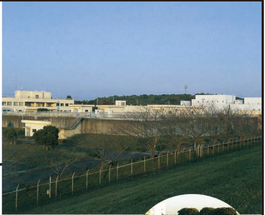
▲ 利根川浄水場全景

利根川を水源としており、よりおいしく安全な水の供給を目的として、オゾン+粒状活性炭高度浄水処理設備を導入しております。