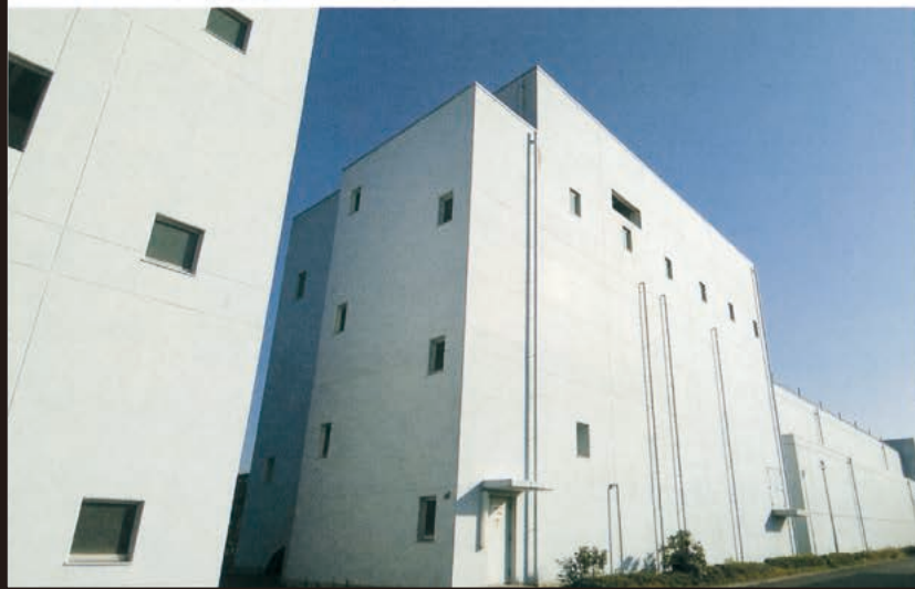
▼ オゾン+粒状活性炭処理棟