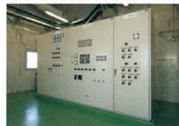
▼ オゾン設備監視制御盤