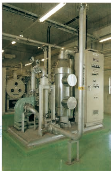
▲ 排オゾン分解装置