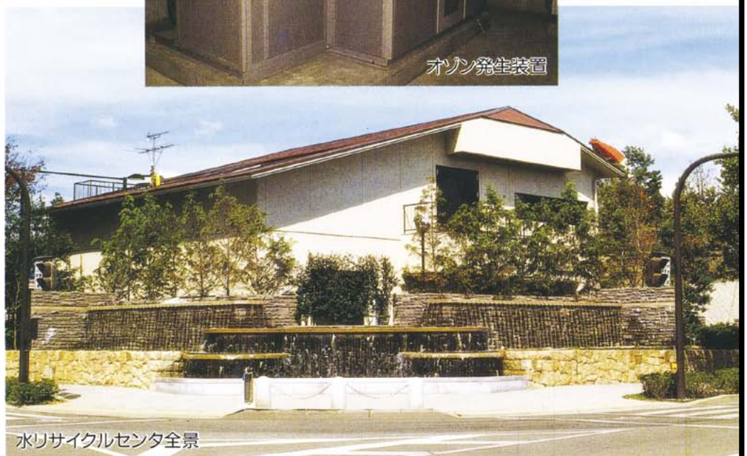
水リサイクルセンタ全景