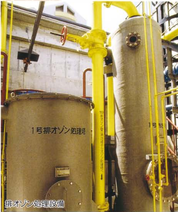
排オゾン処理設備