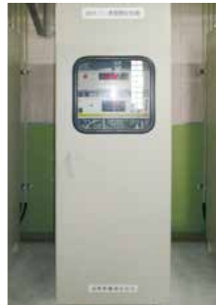
▲ オゾン濃度測定装置