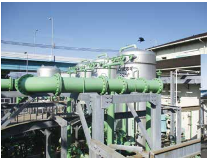
▲ オゾン反応設備外観