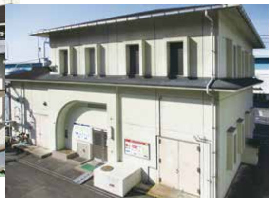
▲ 再生処理施設外観