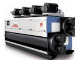
チラー(AQS社販売製品)