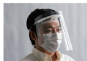
当社製フェイスガード

設計となっており、安全性と使いやすさの検証を重ね開発したものです。今後も、感染拡大防止と社会経済活動の両立に貢献してまいります。